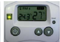
Abb. C: Modus Heizbetrieb in eingeschaltetem Zustand, Verbraucher eingeschaltet, da IST-Temperatur unterhalb der SOLL-Temperatur