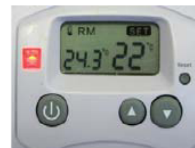
Abb. B: Modus Heizbetrieb in eingeschaltetem Zustand, Verbraucher nicht eingeschaltet, da SOLL-Temperatur unterhalb der IST-Temperatur