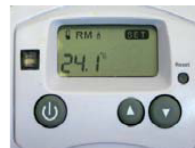
Abb. A: Modus Heizbetrieb im ausgeschalteten Zustand